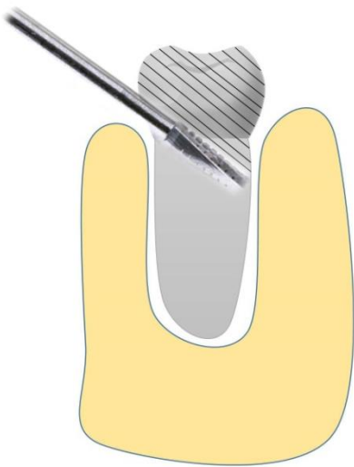
Figura 2 – Preparo do remanescente 3mm abaixo da crista óssea.

de irrigação abundante com solução salina estéril e aspiração para limpeza da área operada. Todo e qualquer fragmento solto deve ser removido, deixando o campo operatório limpo. 5